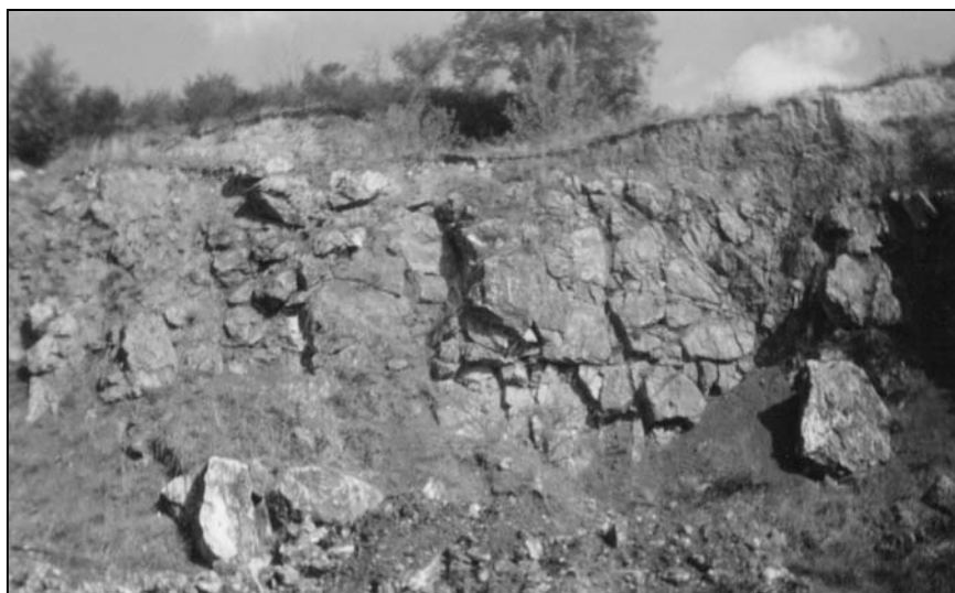
Obr. 2 Horný ónyxový kameňolom. Fig. 2 Upper onyx quarry.

výlučne na tzv. horný ónyxový kameňolom (obr. 2). Opracovanie suroviny je ľahké, neštiepi sa, dobre sa leští. Leštením získava sklený, takmer jednotný lesk. Kvalitnejší lesk je viditeľný na rovnobežných plochách so zvrstvením. Atraktívna surovina je aplikovateľná vo výrobe bižutérie, na výrobu drobných plastík a reliéfnej rezby (Ďuďa et al., 1985).