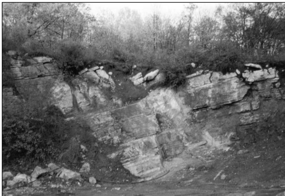
Obr. 3. Pohľad na kameňolom pri Silickej Brezovej. Fig. 3. Look on quarry near Silická Brezová.

okrajov. Celkový vzhľad plastík a drobných ozdobných predmetov pôsobí esteticky, s možnosťou využitia farebnej a textúrnej variability (Ďud'a et al., 1985).