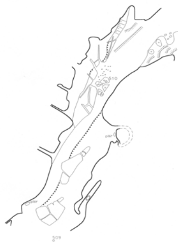
Obr. 3. Ukázka grafického výstupu z části hlavní chodby jeskyně Býčí skála. Fig. 3. Graphic output from the tail of general corridor of the cave Bull stone.

Druhý blok přednášek zajišťují kmenoví pracovníci Ústavu geodézie a je věnován zejména specifickým aspektům mapování pozemních prostor – např. způsobům stabilizace měřické kostry, výběru objektů měření, vlivu prostředí na měřický proces nebo způsobům znázornění situace ve výsledném kartografickém díle.