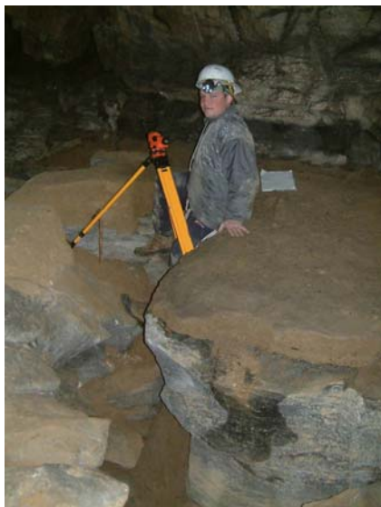
Obr. 2. Nivelace v rámci semináře Speleologické mapování. Fig. 2. Leveling survey in frame of the seminar of Speleologic mapping.

Seminář sestává ze dvou na sebe navazujících částí – přednášek a terénní praxe. V rámci prvního bloku přednášek jsou nejprve studenti seznámeni se základy některých vědních disciplín majících ke krasovému fenoménu úzký vztah - krasové geologie, geomorfologie, hydrologie a biologie. Přednášky jsou zajišťovány externím pracovníkem – významným znalcem v oboru a dlouholetým praktickým speleologem, který výklad doprovází bohatým obrazovým materiálem a ukázkami přírodnin.